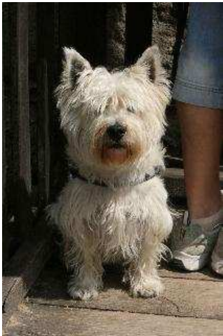
West-Highland-Mann auf Burg Oybin "ich sehe alles"