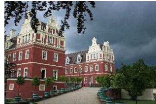
Schloß, Orangerie, Oldtimer-Museum

4. Tag: Ein Spaziergang durch den Fürst-Pückler-Park gehört zum Pflichtteil der Radtour.